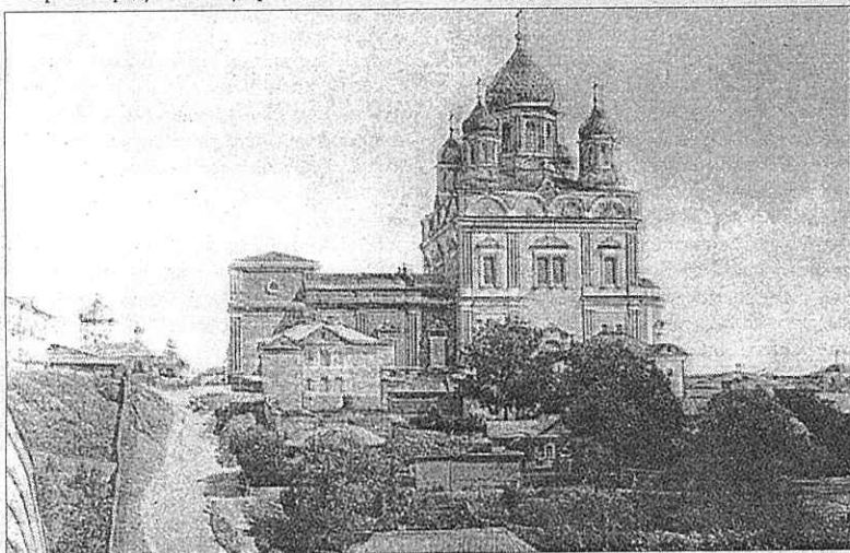
Вид на Вознесенский собор